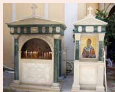
У входа в храм