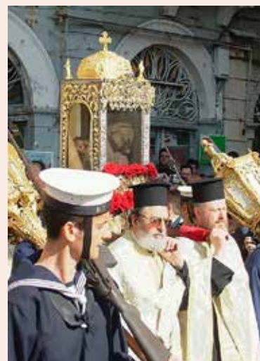
Крестный ход с мощами Св. Спиридона

В тот день, когда Гоголь приехал на поклонение святому, верующие, как это заведено каждый год 12/25 декабря, с большой торжественностью обносили святые мощи вокруг города. При этом все присутствующие обычно благоговейно и трепетно прикладываются к ним. Однако на этот раз среди них находился некий английский путешественник, естественно, возвращенный на скепсисе и рационализме протестантской культуры. Он позволил себе заметить, что, по всей видимости, в спине угодника сделаны надрезы и тело тщательно набальзамировано. Чуть позже он подошёл к мощам поближе. Каково же было его граничащее с ужасом изумление, когда мощи святого на глазах у всех... медленно приподнялись из раки и обратились своею спиной именно к этому «идейному» наследнику апостола Фомы, прозванного «неверующим»: на, мол, дружок, поищи-ка «свои» надрезы! Какова дальнейшая судьба этого достопочтенного британца, к сожалению, неизвестно. Гоголя же это чудо потрясло до самых глубин души.