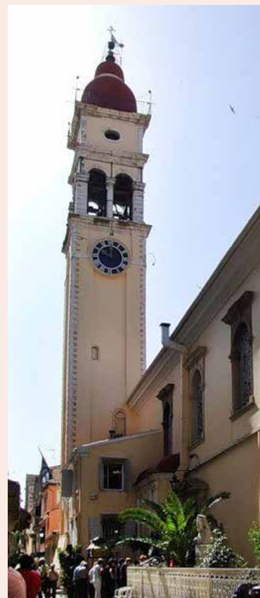
Храм Св. Спиридона