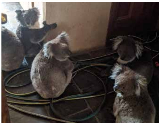
Коалы прячутся в доме в Кесбруке