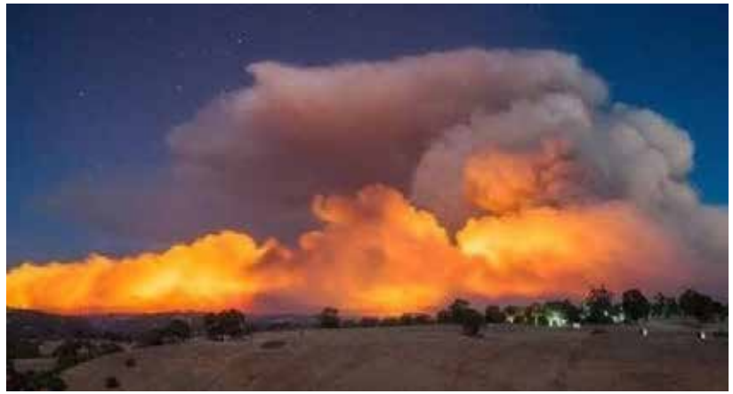
Северо-восточные пригороды Аделаиды