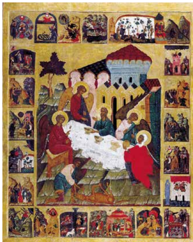
Святая Троица в бытии, икона 1580-х годов

Вот на этом языке и приходится нам учиться говорить всю нашу жизнь. И грамматической ошибкой здесь является грех, холодность и отчуждённость. Здесь легко запутаться в спряжениях и согласованиях. Как сопрягаются, например, наши правды и единственная Истина? «Я затосковал в своих маленьких правдах и захотел Истины», – так однажды сказал о себе один вполне преуспевающий молодой журналист, друг Марины Цветаевой и наследник громкого аристократического имени. Он ушёл на Афон и вместо титула «князя Шаховского» приобрел имя «монаха Иоанна».