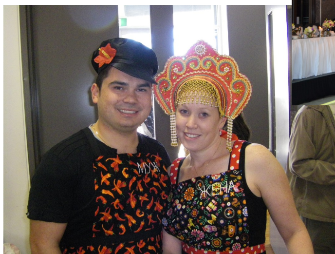
Уже муж и жена