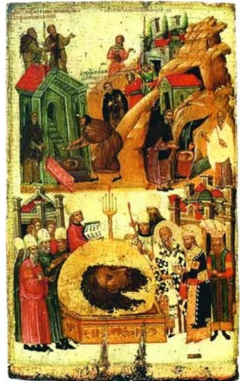
Три обретения честной главы св. Иоанна Предтечи (икона XIV в., Великая Лавра на Афоне)

Иоанн Креститель (Иоанн Предтеча) — ближайший предшественник Иисуса Христа, предсказавший пришествие Мессии, жил в пустыне аскетом, затем проповедовал крещение покаяния для иудеев, крестил в водах Иордана Иисуса Христа, затем был обезглавлен из-за козней иудейской царевны Иродиады и её дочери Саломеи. Иродиада была женой Ирода Филиппа, но была отнята у него тетрархом Галилеи Иродом Антипой, за что Иоанн обличал последнего. Ирод Антипа заключил Иоанна в тюрьму, но казнить его не решался (Мф.14:3-5, Мк.6:17-20). Дочь Иродиады Саломея (не названная в Евангелиях по имени) в день рождения Ирода Антипы «плясала и угодила Ироду и возлежавшим с ним». В награду за танец Ирод пообещал Саломее выполнить