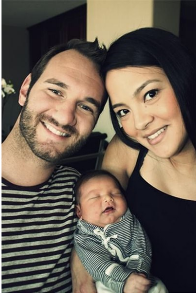
Ник с женой и сыном

столкнуться. Я понимал, что он будет страдать, и мне было жаль его. Но я понимал и то, что мы с родителями сможем облегчить груз, лежащий на плечах малыша и его родителей. Я знал, что буду встречаться с этим ребенком и дарить ему надежду. Мои родители прошли тот же путь, но им никто не помог. И я был уверен в том, что они будут благодарны за возможность помочь этой семье. Мне посчастливилось получить немало таких писем. Теперь мне удивительно, что в детстве я не умел ни радоваться собственной жизни, ни обогащать жизнь других людей. Возможно, вы ещё только ищете смысл жизни. Но я не думаю, что вы сможете обрести его без служения окружающим. Каждый из нас надеется применить свои таланты и знания с пользой, а не только ради оплаты текущих счетов.