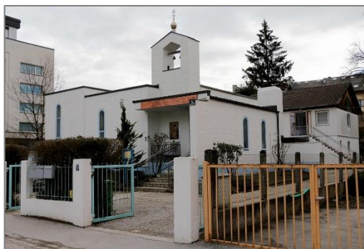
Так наш храм выглядит сегодня